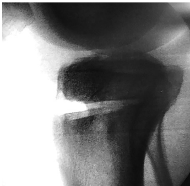
Figura 5: Foto de rodilla de perfil. Control con intensificador de imágenes de osteotomía de deflexión. Puede observarse indemnidad de cortical posterior.

Paciente en decúbito dorsal con rodilla en flexión de 90 grados y manguito hemostático en la raíz del muslo. Se comienza con la evaluación artroscópica seguida del tratamiento de lesiones asociadas de cartílago y meniscos.