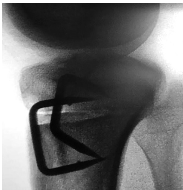
Figura 6: Foto de rodilla de perfil y frente. Control con intensificador de imágenes de osteotomía de deflexión. Cierre y fijación con 2 grapas a los costados del tendón rotuliano.

Luego se realiza la osteotomía tibial de deflexión. Mediante un abordaje longitudinal anterior infrapatelar, se expone la tibia anterior proximal (fig. 2). Se colocan 2 clavijas guías a ambos lados del tendón rotuliano, a 2 cm distales y paralelas a la superficie articular de la tibia. Y a continuación, 2 clavijas accesorias a las anteriores, distales y convergentes en la cortical posterior, todo bajo control radioscópico, determinando así el tamaño de la cuña de sustracción de base anterior. Se considera que cada 1 mm de corrección se modifica 1° (figs. 3 y 4).