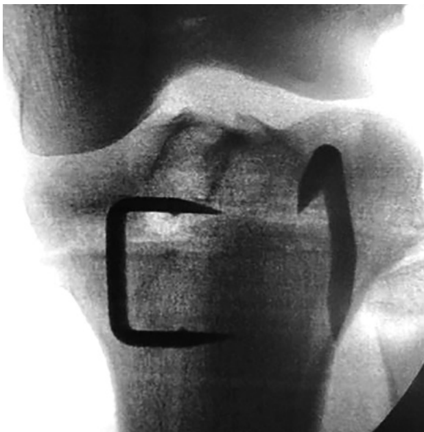
Figura 7: Foto de rodilla de perfil y frente. Control con intensificador de imágenes de osteotomía de deflexión. Cierre y fijación con 2 grapas a los costados del tendón rotuliano.

coplos a ambos lados, y por detrás del tendón rotuliano, teniendo la precaución de mantener la cortical posterior intacta (fig. 5). Posteriormente, con una mecha se realizan perforaciones a este nivel para debilitarla y que sea más fácil la deflexión. Se cierra la osteotomía mediante una maniobra de extensión de rodilla de acuerdo a la medición previa del slope y se realiza la fijación con una grapa a cada lado del tendón rotuliano (figs. 6 y 7).