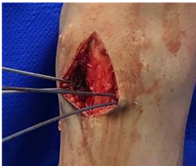
Figura 3: Dos clavijas guías a ambos lados del tendón rotuliano, a 2 cm distales y paralelas a la superficie articular de la tibia. Y 2 clavijas accesorias a las anteriores, distales y convergentes en la cortical posterior, determinando así el tamaño de la cuña de sustracción de base anterior.