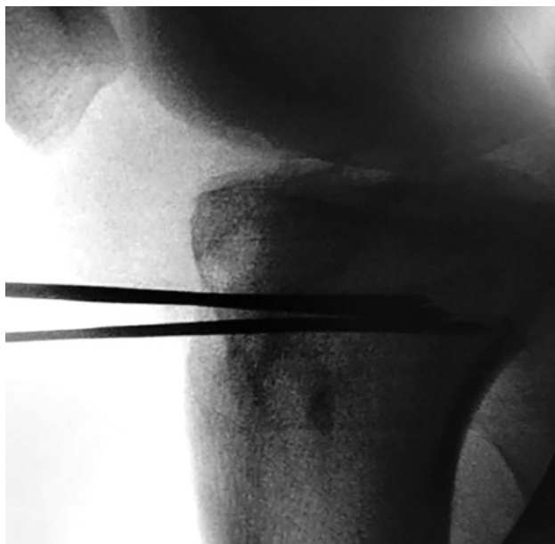
Figura 4: Foto de rodilla de perfil. Control con intensificador de imágenes de clavijas convergiendo en cortical posterior, sin violarla.

rior de la tibia seguido luego por un segundo círculo centrado en el borde del primer círculo, y luego se une la línea que conecta los centros de ambos círculos. Posteriormente, se realiza una línea perpendicular al eje diafisario tibial a nivel de la interlínea articular y otra línea tangente al platillo tibial medial y lateral, se mide el ángulo formado entre ambas. 16