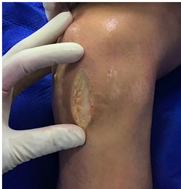
Figura 2: Insisión anterior sobre tendón rotuliano.

co de la tibia y considera el ángulo que se forma entre una línea perpendicular a dicho eje y la tangente al platillo tibial medial. 6