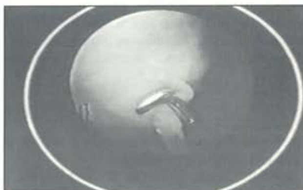
Lesión pseudomeniscal. Grado 1