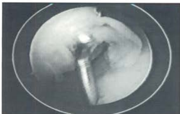
Lesión grado II desorganización del cartilago.

rótula), inestabilidad de rodilla (ruptura de LCA), como así también lesiones por fricción de partes blandas, alteraciones congénitas y posiciones forzadas.