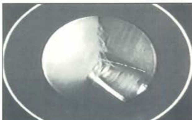
Tratamiento con resección condral